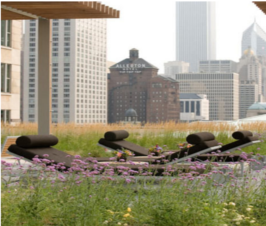
Taghave fra Chicago

Intensive grønne tage er taghaver med større planter, buske og træer og har derfor en højere vægt.