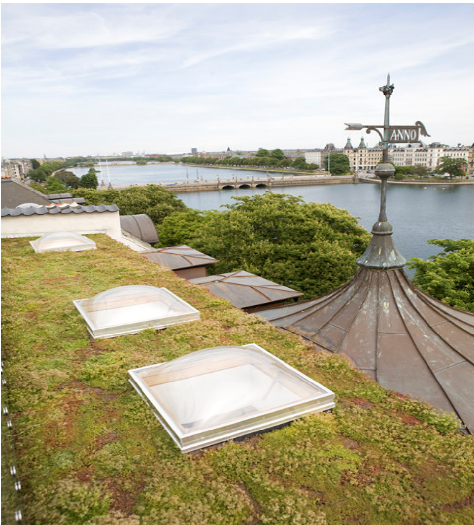
Grønt tag på eksisterende bygning på Peblinge Dosseringen

Der er få, om nogen teknologi, der kan give så mange fordele for den offentlige og private sektor som grøn tag infrastruktur. De er i høj grad en funktion af design, struktur og stedsmålrrettede betingelser. Der er mange fordele, der er fælles for alle grønne tage, andre skabes gennem unikke design-løsninger for det specifikke tag. Nogle fælles fordele ved grønne tage opnås ved henvendelse til offentligheden som helhed, mens andre arbejder til fordel for de private parter, der investerer i eller direkte anvender grønne tage.