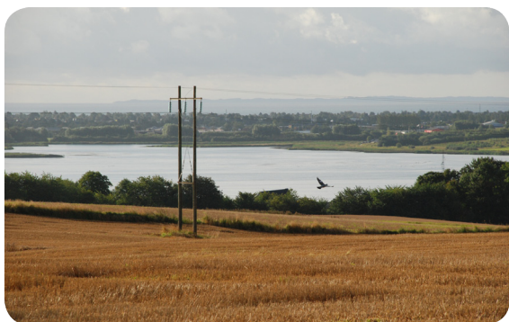
Egådalen nord for Aarhus

I Aarhus ophobes vand fra ekstremregn og højvande i en ny sø i Egådalen. Søen reducerer samtidig kvælstofudvaskningen fra landbruget til Aarhus Bugt. Nu vil kommunen fortsætte succesen og forsøge at etablere yderligere et vådområde. Det vil kunne ophobe vand fra et skybrud i ½-1 døgn og dermed reducere risikoen for oversvømmelse af de mange boliger langs den nedre del af Egå.