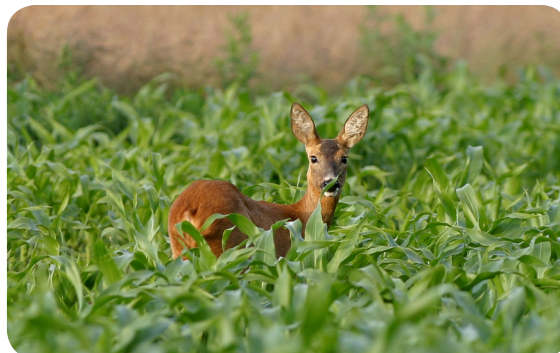
Rådyr i majsmark

Dyrkningsarealet for fodermajs er mangedoblet på få årtier i takt med stigende middeltemperatur. Det skyldes, at majs, under de rette temperaturforhold, giver et større udbytte end kornarterne. I lande som f.eks. Belgien og Frankrig udgør arealet med kernemajs ca. 20 pct. af kornarealet. Det forventes derfor, at arealet med kernemajs i Danmark i løbet af 30-40 år, med den forventede temperaturstigning, vil kunne udgøre 10-20 pct. af kornarealet i Danmark. Kernemajsen vil i første omgang erstatte vårbyg og senere vinterhvede.