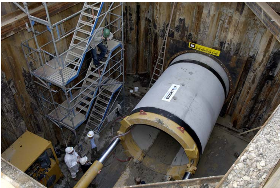
Figur 5. Tunneleringsmaskine i grube i forbindelse med havneprojekt i Odense. Der er tale om store investeringer, når der lægges nye, store kloakrør.

Med hensyn til lovgivning er det ifølge politikerne derfor også især prisloftet i vandsektorloven, som er problematisk, da det gør, at spildevandsselskaberne mange steder ikke har økonomi til at lave de nødvendige tiltag (se også 'Samspil med staten' nedenfor). Det gælder selvfølgelig især i kommuner, der ikke er helt fremme med vedligeholdelsen af kloaknettet, hvilket ifølge de interviewede politikere er tilfældet for en stor del af de danske kommuner. Hertil skal nævnes at Miljøministeriet netop har bebudet, at vandsektorloven ændres, så det bliver mere klart, hvilke miljø- og servicemål kommunerne kan søge om tillæg til prisloftet for at finansiere (Miljøministeriet 2012a).