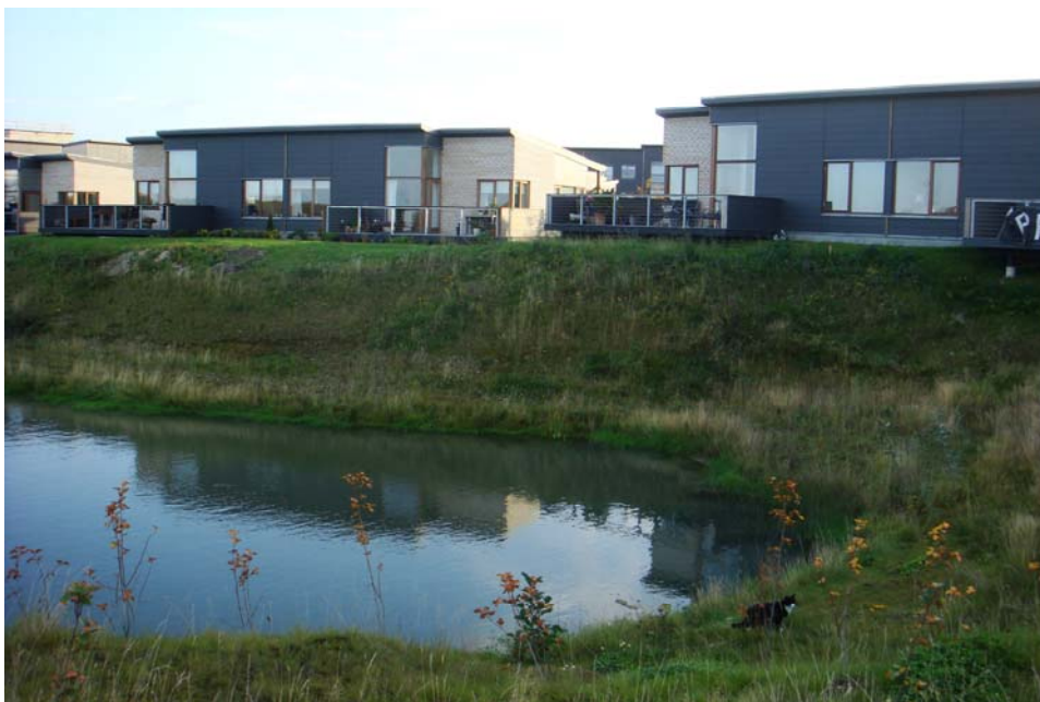
Figur 2: Håndtering af regnvand er iflg. politikerne et af hovedproblemerne i forhold til klimatilpasning. Her ses regnvandshåndtering i Stenløse.

Man kan dog diskutere, hvor langsigtede og visionære strategierne og målene er. Eftersom det i høj grad har været konkrete problemer med oversvømmelser, der har bragt klimatilpasning på dagsordenen (se afsnittet nedenfor om, hvorfor klimatilpasning kommer på dagsordenen), kan man argumentere for, at politikerne handler reaktionært på klimaforandringer frem for visionært. Det er også kun i et begrænset omfang, at politikerne er helhedsorienterede i den forstand, at de kobler klimatilpasning med andre sektorer end teknik og miljø. Håndteringen af regnvand og oversvømmelsestrusler fra havet er de eneste problemer, politikerne referer til i forbindelse med klimaforandringer.