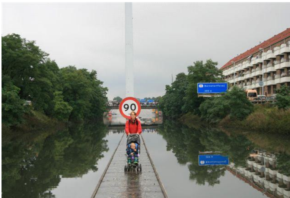
Figur 3: Oversvømmelser er en af hovedårsagerne til at klimatilpasning kommer på dagsordenen. Her er det Lyngby-vejen i København, der er ramt.

Mediedækningen af klimaproblematikker har også gjort, at emnet, i politikernes opfattelse, optager kommunens borgere. Og de oplever derfor et vist borgerpres for at håndtere de truende effekter af klimaforandringer og selvfølgelig i særlig høj grad, når borgerne oplever gener som følge af oversvømmelser. Enkelte politikere nævner, at det er for risikabelt at lukke øjnene for de problemer, klimaforandringerne kan afstedkomme: