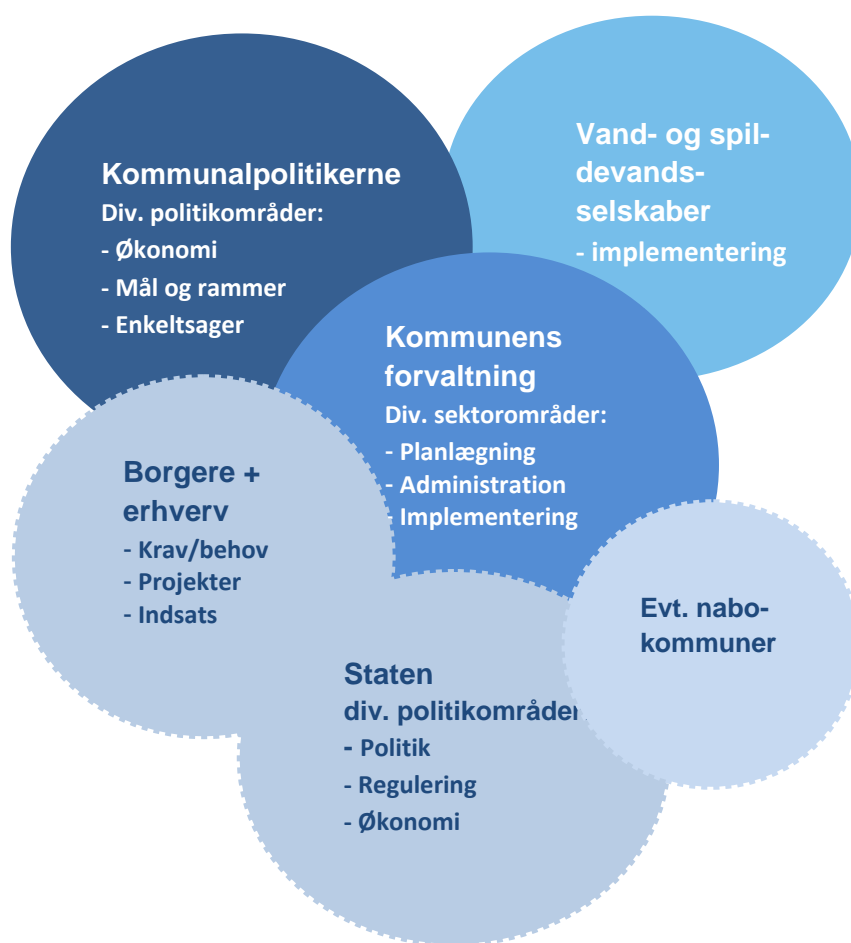
Figur 6. Samarbejdsarenaer. Forvaltningen er helt central for kommunernes klimatilpasning.