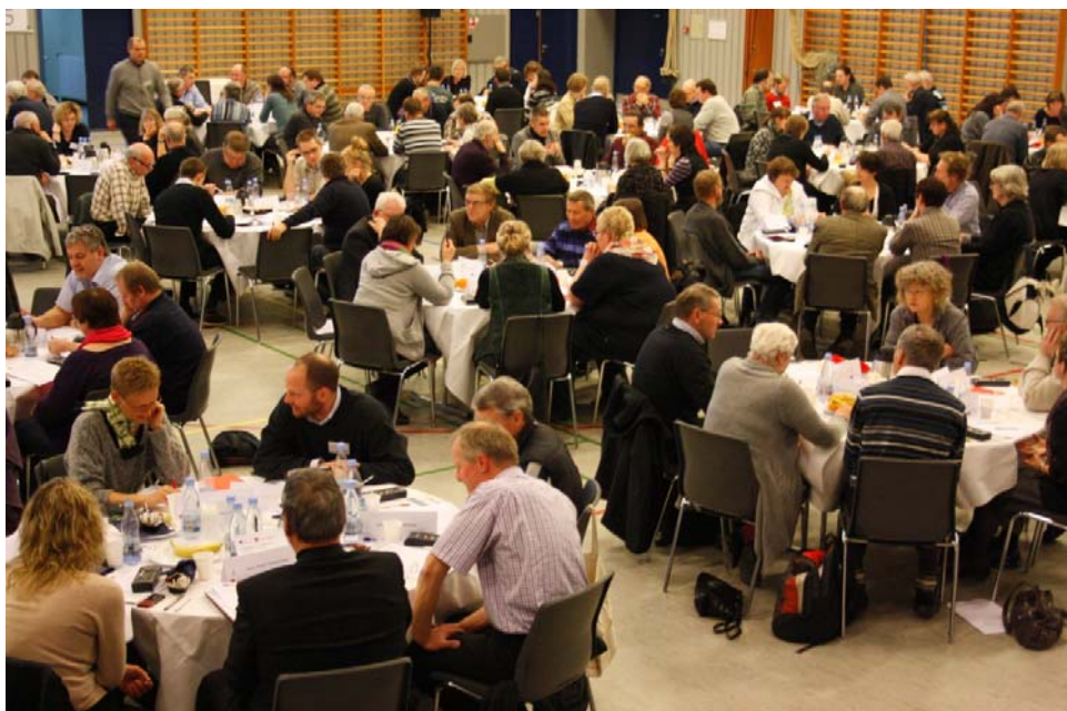
Figur 7. Borgertopmøde i Kalundborg.

kerne kunne bruge som støtte i udarbejdelsen af deres klimatilpasningsstrategi. Læs mere herom i boks 1.