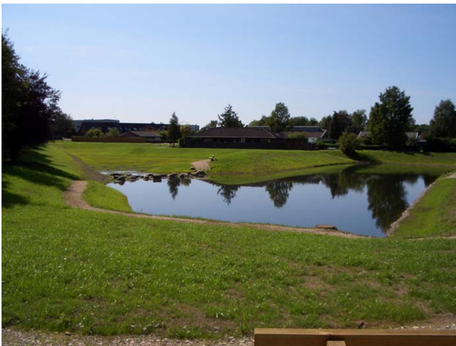
Figur 8: Regnvandsbassin i Odense hvor der tidligere lå parcelhuse. Kommunen købte husene, rev dem ned, og anlagde dette regnvandsbassin, da området var stærkt plaget af oversvømmelser. Et konkret projekt som dette vil typisk involvere direkte inddragelse af de berørte borgere.

I flere af kommunerne er der dialogfora, hvor enkelte politikere og forskellige interesseorganisationers repræsentanter mødes og taler om miljø og klima, herunder klimatilpasning.