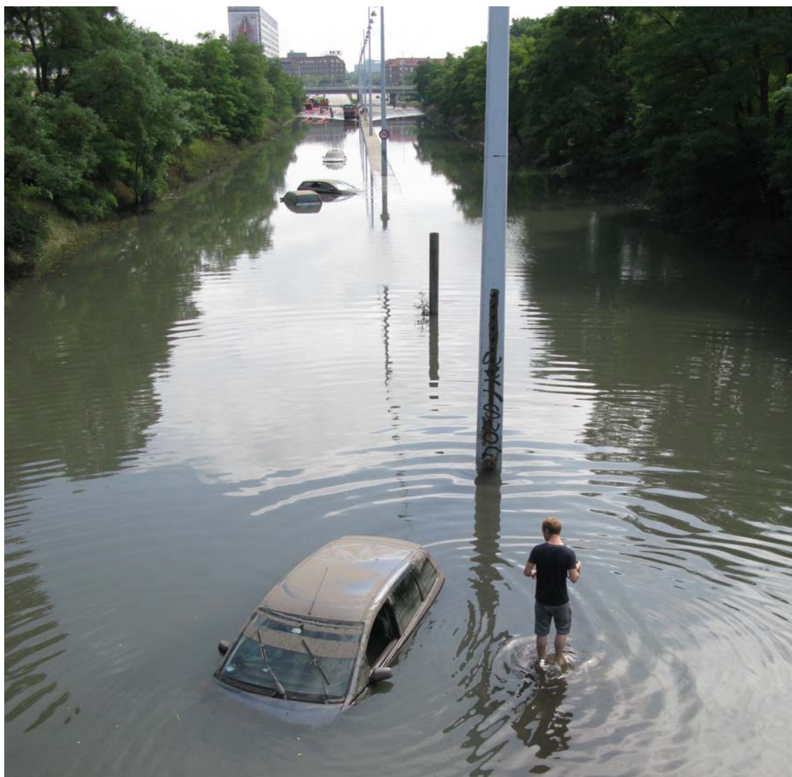
Lyngbyvejen efter ekstremregn i august 2010.

vandsplan, og der er igangsat et projekt om LAR. Spildevandsplanen skal sikre en tilstrækkelig afledningskapacitet, og der er derfor sket en massiv udbygning af bassiner og ledningsnet, så ekstremregn af karakteren 10-årshændelser, dvs. hændelser, der statistisk set vil indtræde hvert 10. år, kan håndteres. Der regnes med, at der i disse hændelser vil være tale om 30 % mere intensiv regn, så afløbssystemerne skal kunne klare 30 % mere regn end i dag. Statistisk set sjældnere og kraftigere nedbørsmængder vil føre til oversvømmelser og overfladeafstrømning. Denne afstrømning kan dog styres ved hjælp af blandt andet høje kantsten, så vandet ledes hen til de mindst sårbare områder. Principperne bag afledningen af spildevand er, at regnvandet skal nyttiggøres lokalt, forurenede regnvand renses før nyttiggørelse, og husholdningsspildevand sendes til rensningsanlæg. Over de næste 100 år forventes klimasikring af afløbssystemet at beløbe sig til 5-15 mia. kr. Københavns Kommune har udarbejdet et metodekatalog til LAR 17