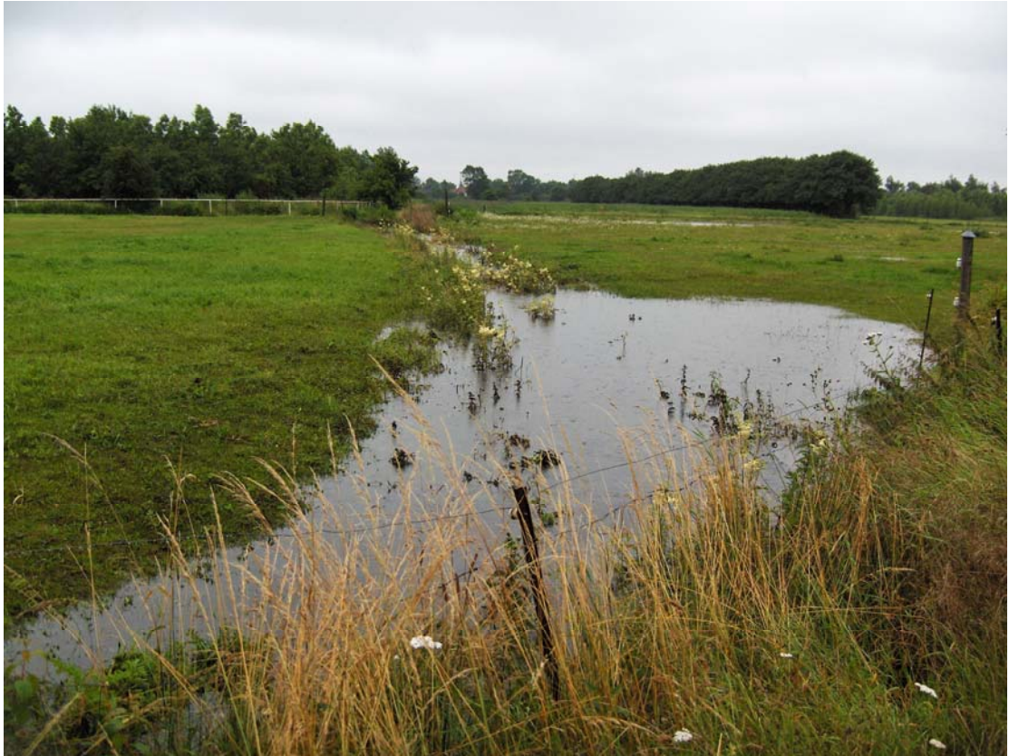
Vand i det åbne land, Dragør Kommune.