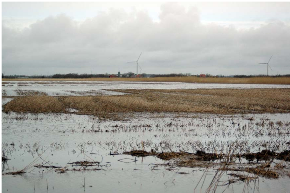
Vislev enge oversvømmet.

Der er ikke udført en samfundsøkonomisk vurdering af effekterne af klimaændringer.